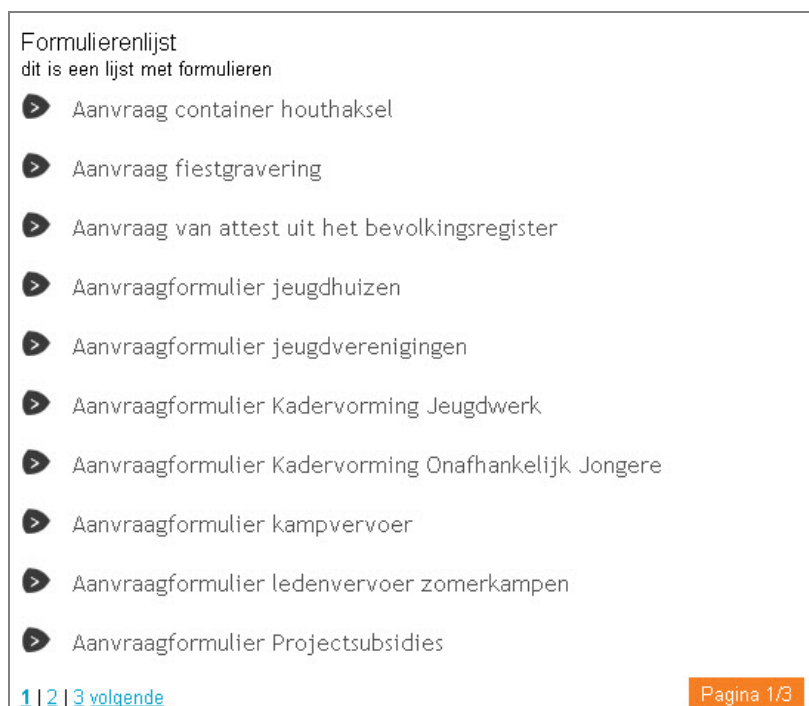
Figuur 1: geavanceerde gerelateerde itemlijst op website.

De module heeft een titel en een omschrijving. De items in de lijst kunnen ook nog een datum en een omschrijving bevatten. Onderaan de module staat de paginering, waardoor de gebruikers door de lijst kan bladeren.